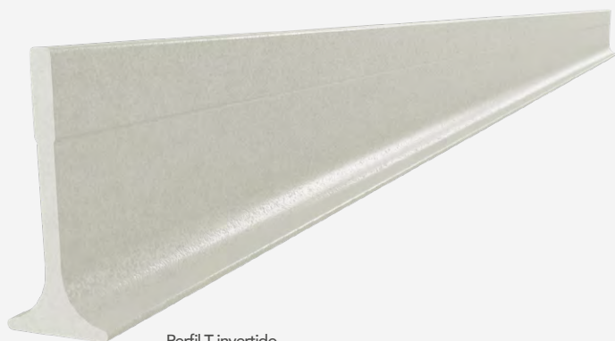
Perfil T invertido